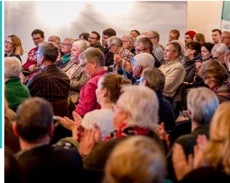
Impression aus dem 1. Forum STEK BM 2035