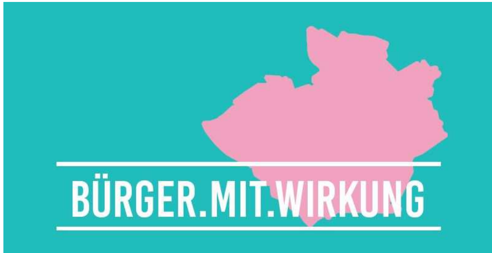
feststehendes Design Bürger.Mit.Wirkung